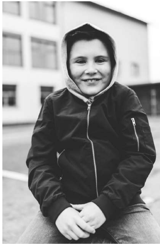
Feiner Zauber 40 €

Bilder als Abzug 15x22 & Download inkl. Porto