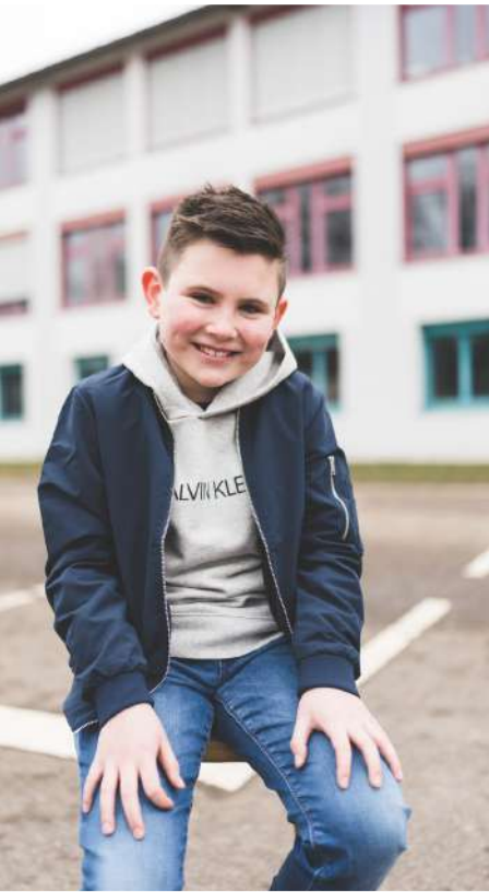
Kleiner Zauber 28 €

1 Gruppenbild 2 Einzelbilder 1 Set Passbilder