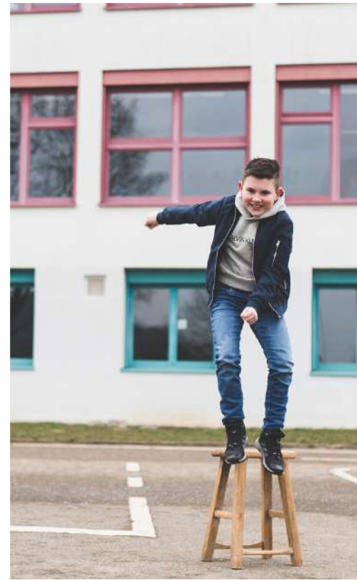
Besonderer Zauber 70 €

Bilder als Abzug 15x22 & Download inkl. Porto